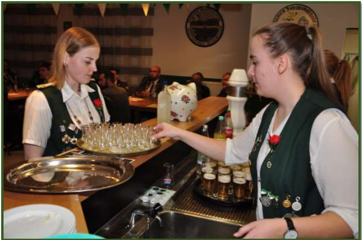
Königin Nina versorgt sich mit Schnapsgläser