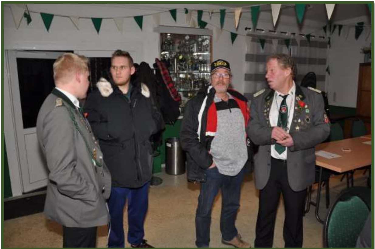
...kommen die Vereinsmitglieder