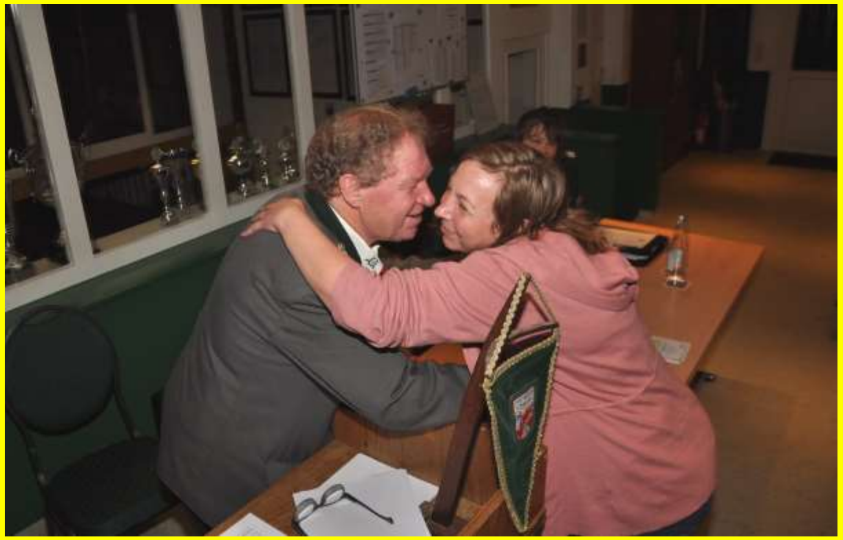
Auch die 2. Kinderobfrau wurde aus dem Vorstand verabschiedet