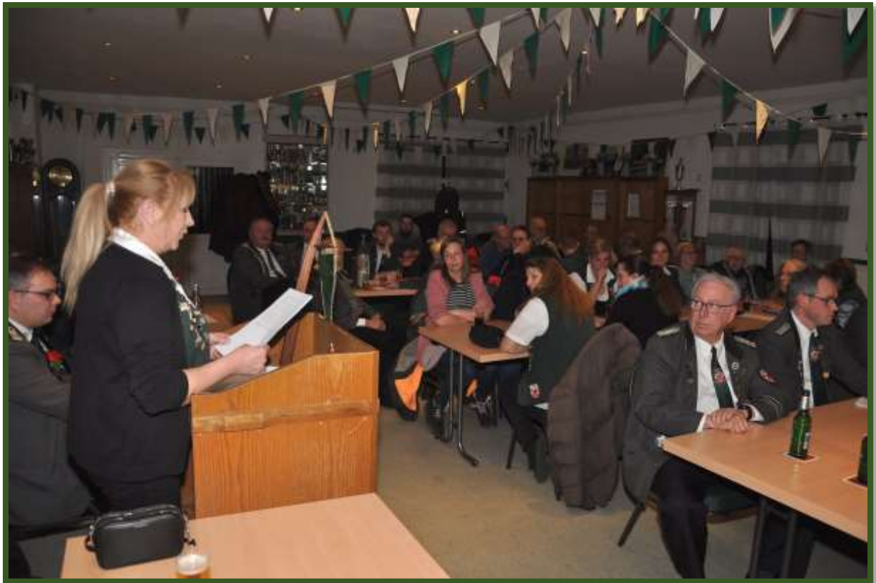
...in der Damenabteilung