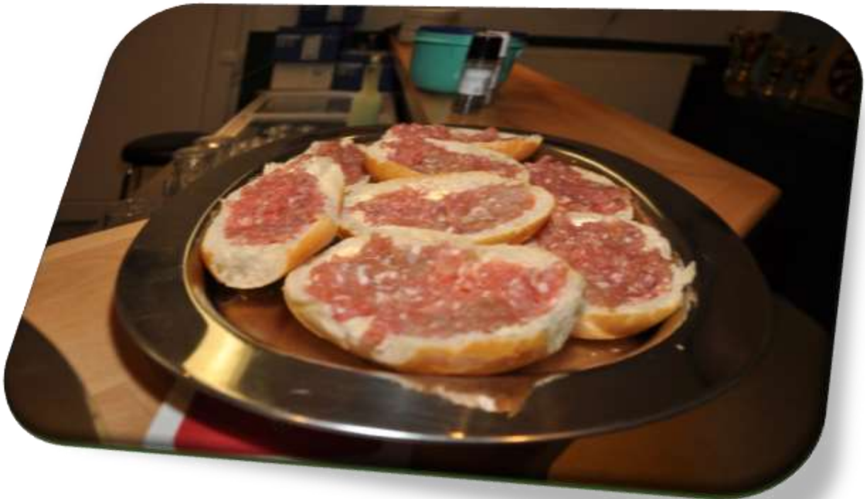
...die Mettbrötchen stehen bereit für die PAUSE