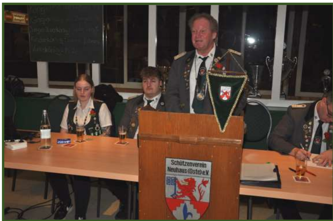
Ein besonderer Dank ging auch an die Kameraden der Ortsfeuerwehr Neuhaus/Oste die beim Aufbau des Autoskooters...