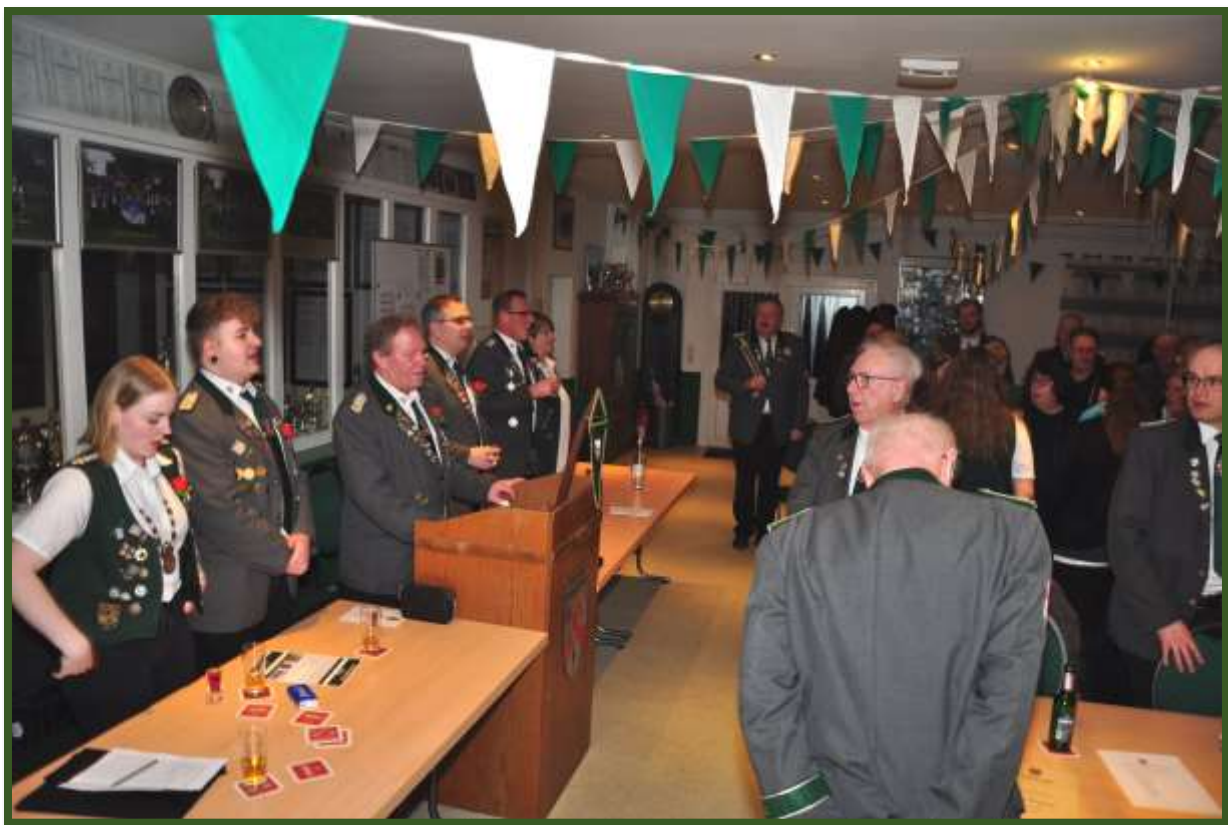
Am Ende der JHV