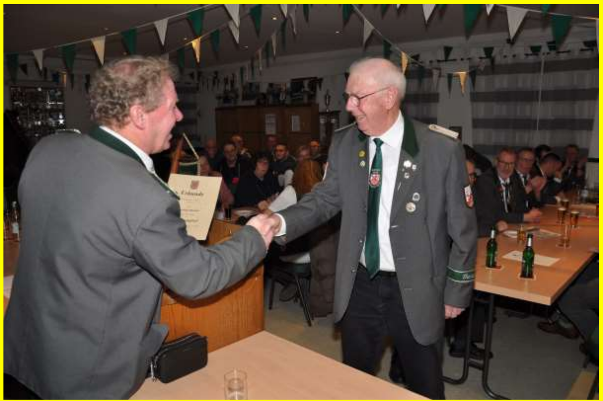
...und die Ehrenmitgliedschaft p. Urkunde