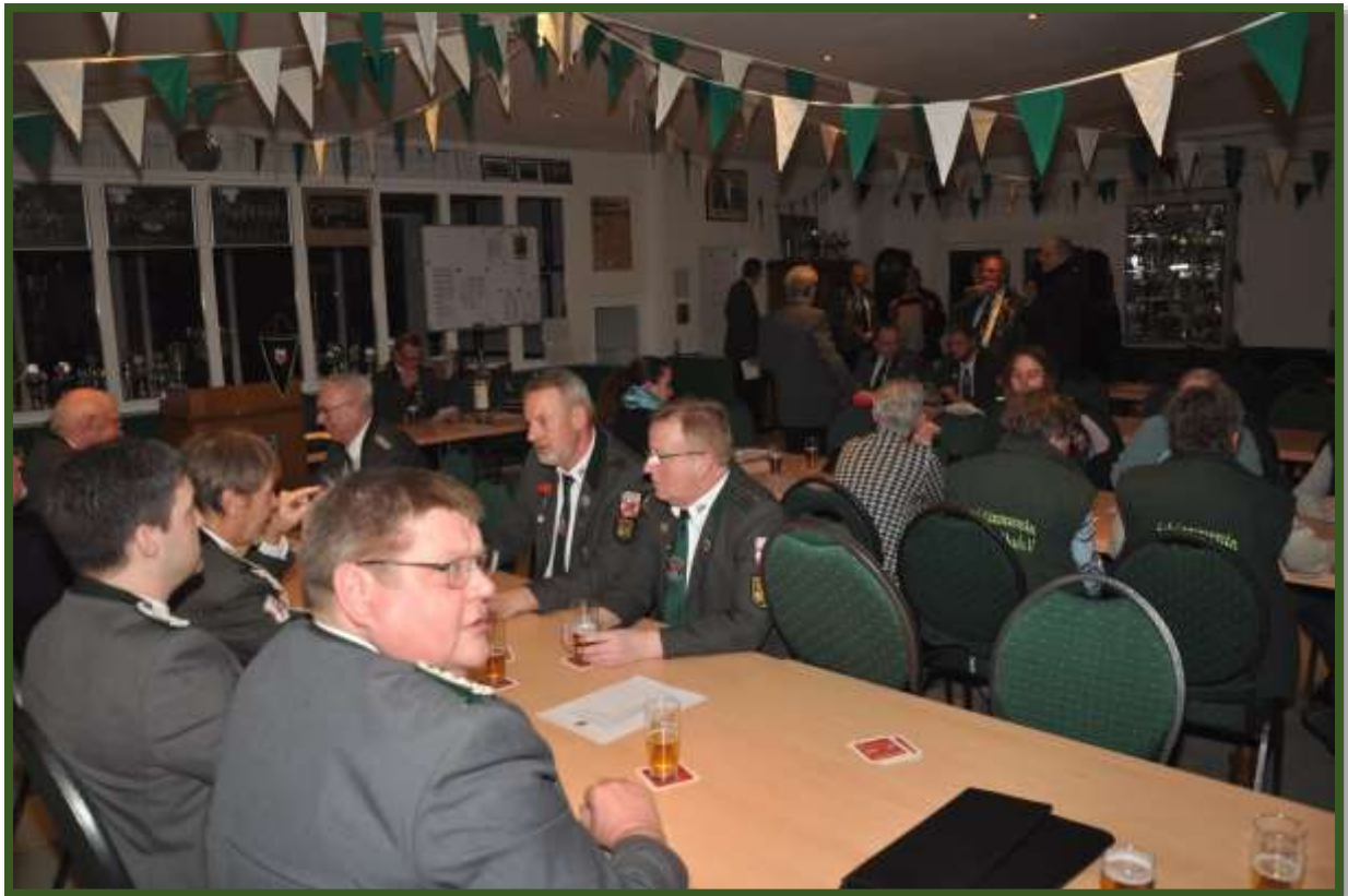
In der Schießhalle am Bürgerpark