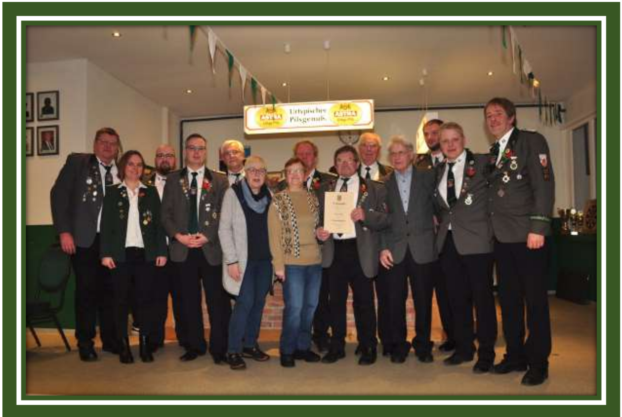
Die neuen Vorstandsmitglieder und die Ausgezeichneten Vereinsmitglieder