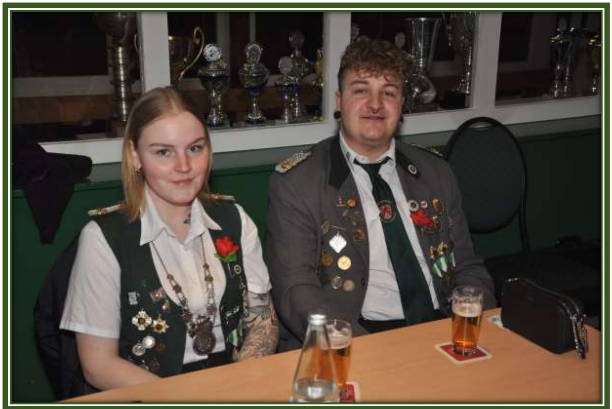
Das Geschwisterpaar von Bargaen ist unser Königspaar