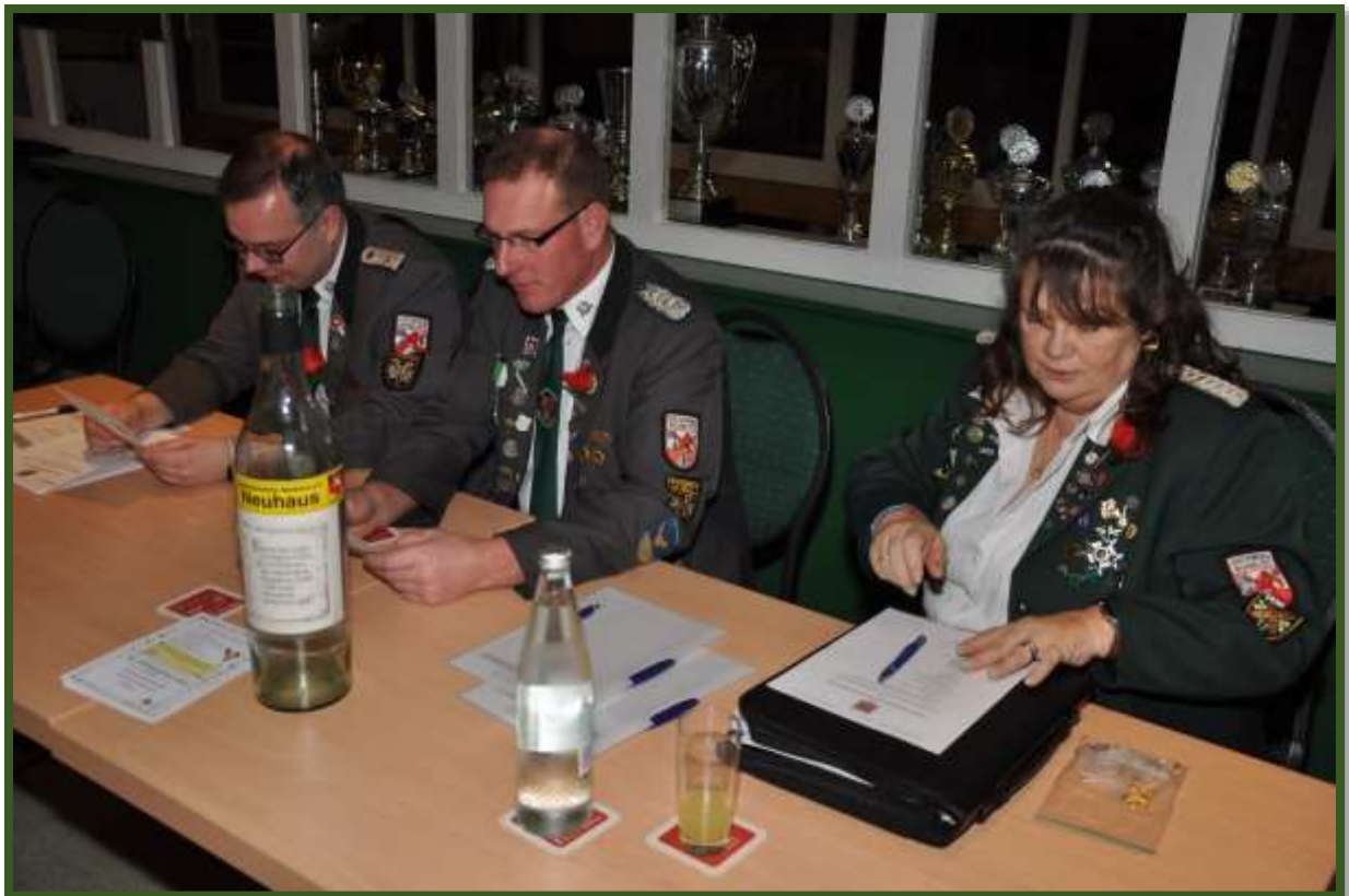
Der geschäftsführende Vorstand hat auch schon Platz genommen