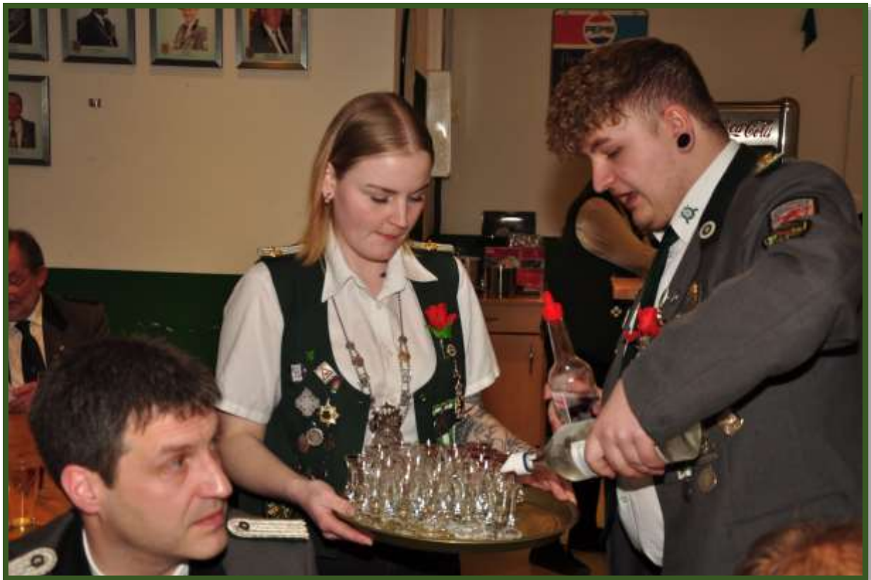
...geben eine Runde Schnaps aus // Dankeschön !