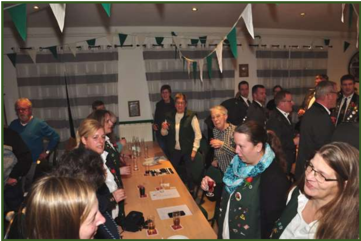
...wird um 22.00 Uhr das Neuhäuser Schützenlied angestimmt.