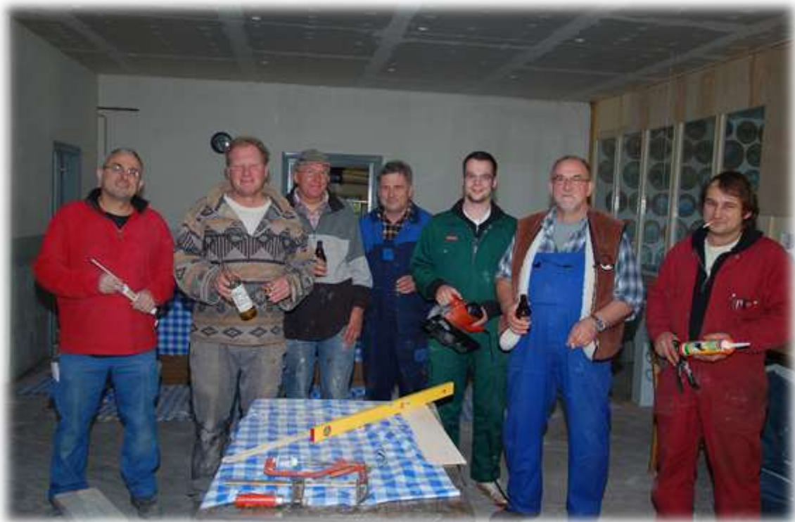
Diese Truppe war Seinerzeit maßgeblich an den Renovierungsarbeiten beteiligt.