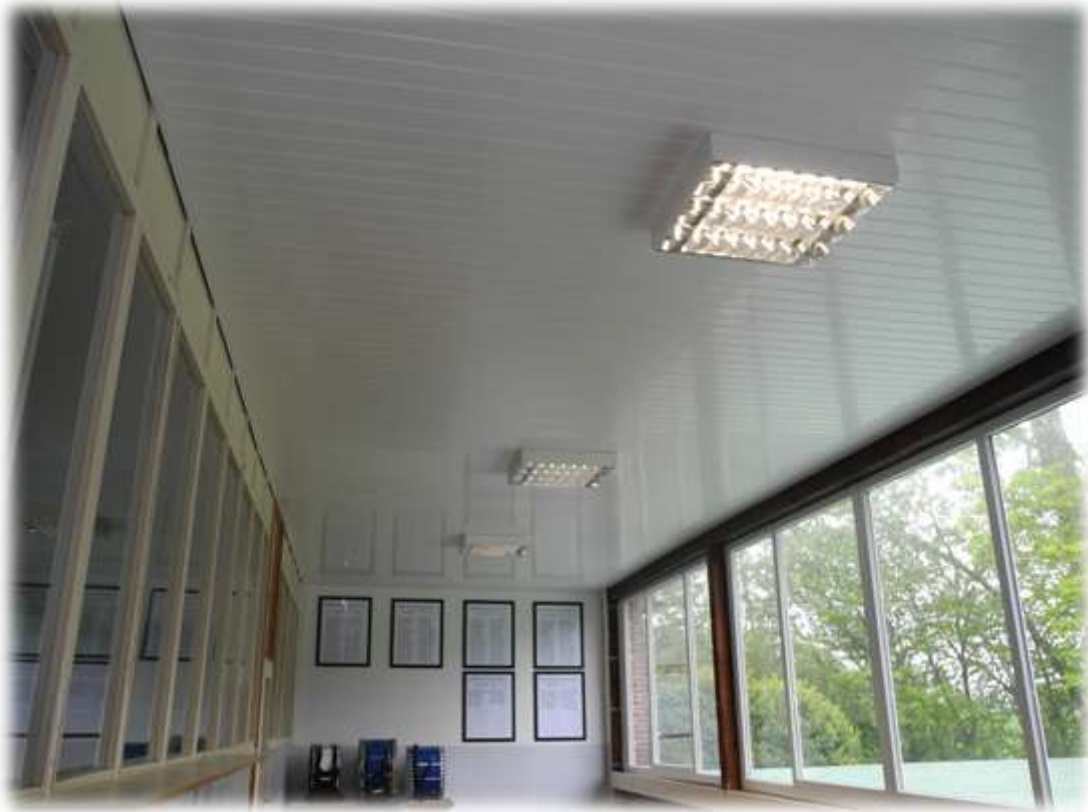
Mit neuen Leuchtkörpern erstrahlt nun die Decke im Schießstand.