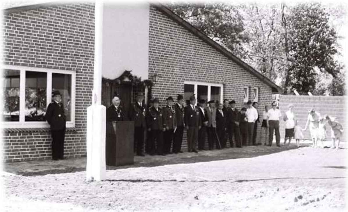
1964 wurde unsere Schießhalle errichtet hier das Bild von der Einweihungsfeier.