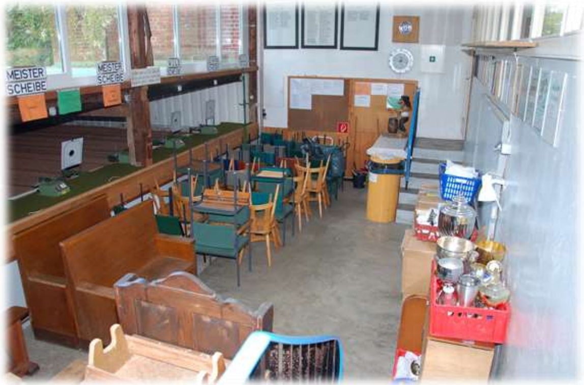
Der Schießstand war von den Arbeiten ausgenommen.