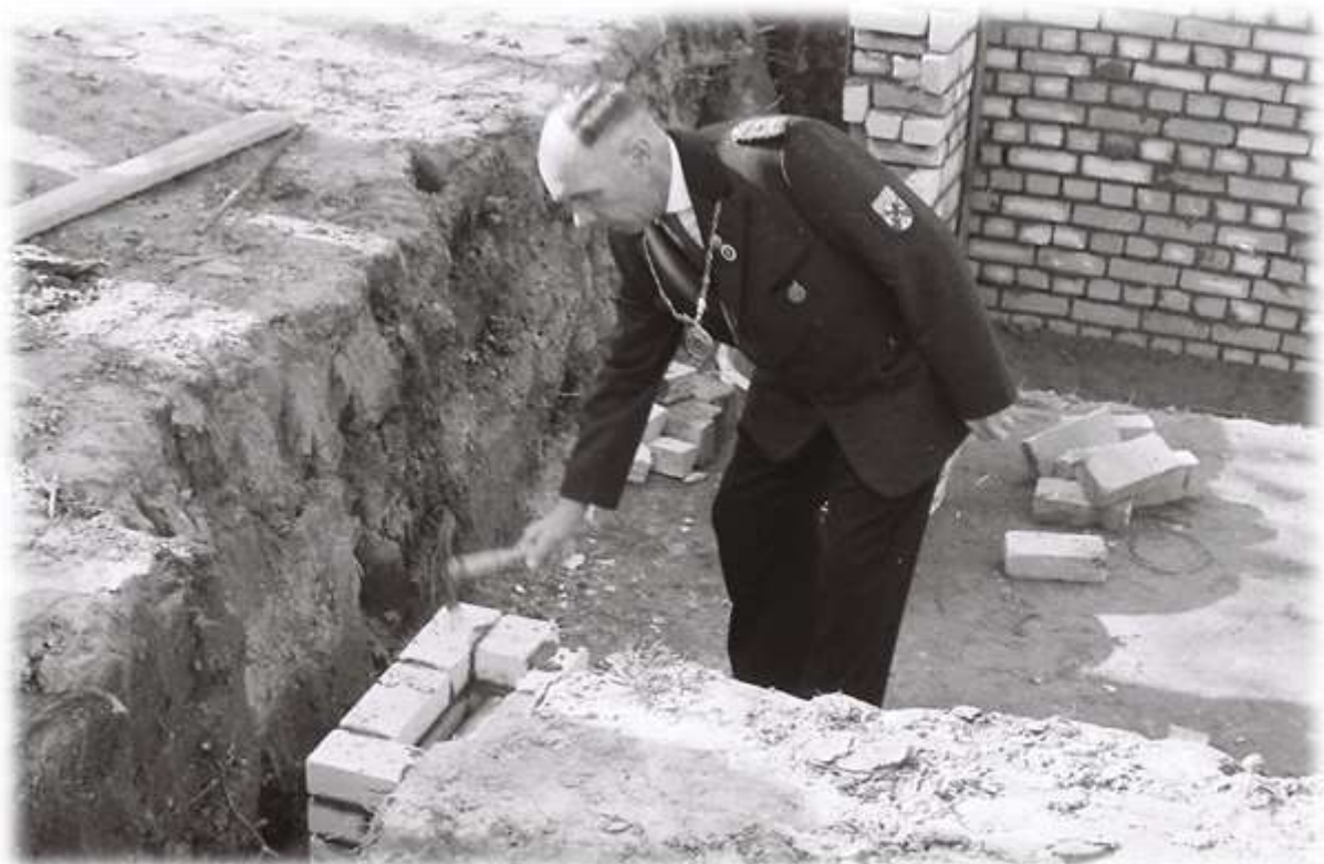
Präsident Wilhelm Seebörger bei der Grundsteinlegung.