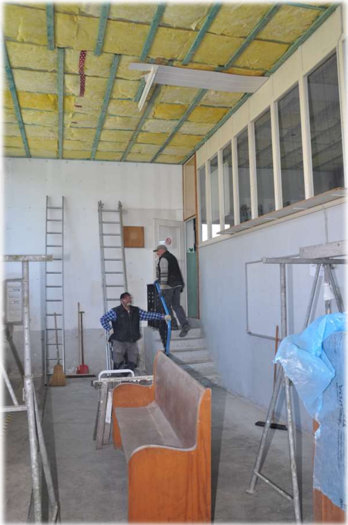
Die alte Decke wurde entfernt und durch eine neue ersetzt.