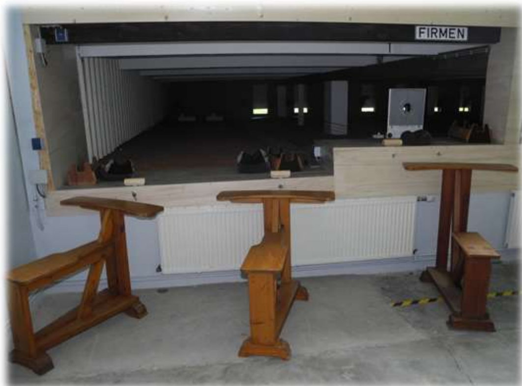
Auf beiden Kinderständen kann nun auch stehend geschossen werden.