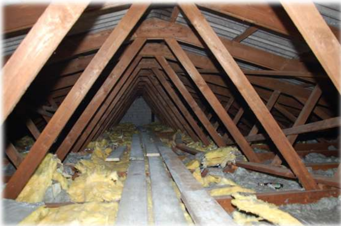
Der Dachraum wurde mit Isoliermaterial ausgestattet.