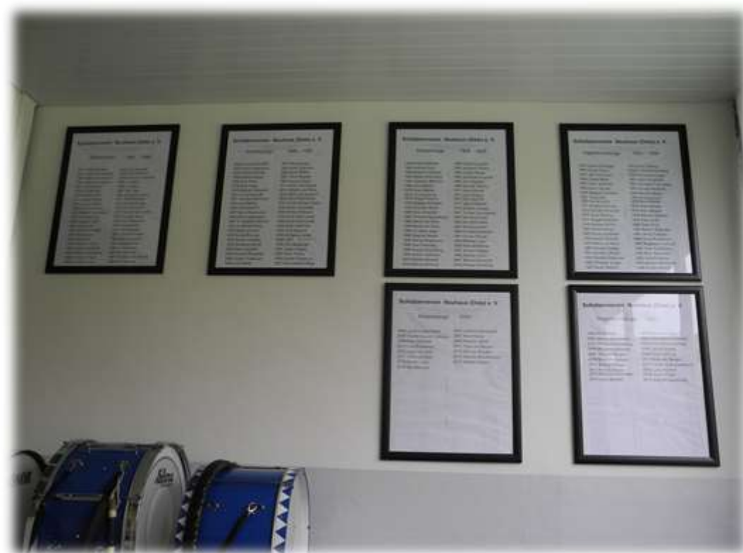
Für die Kinder sind neue Ehrentafeln angeschafft worden. Alle Kinderkönige u. Vogelstechkönige des Vereines sind hier aufgelistet.