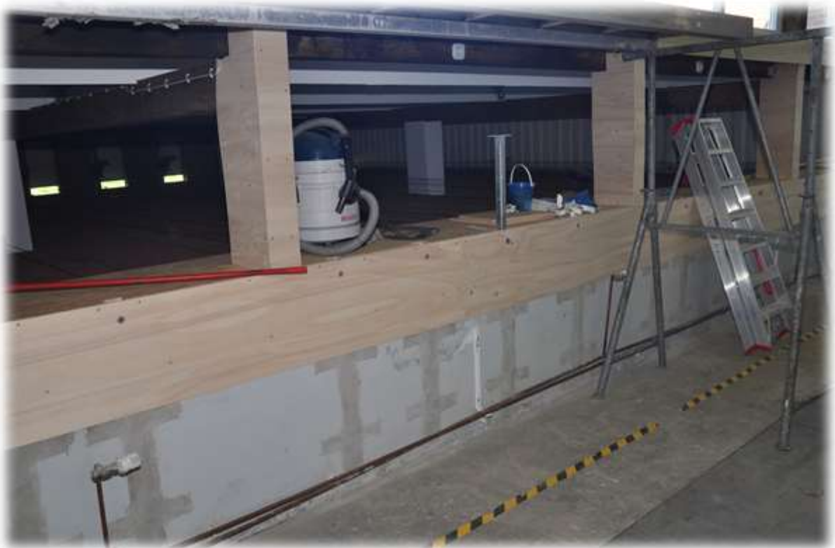
Die Heizkörper wurden abgenommen damit der Schießstand eine neue Holzverkleidung bekommen konnte.